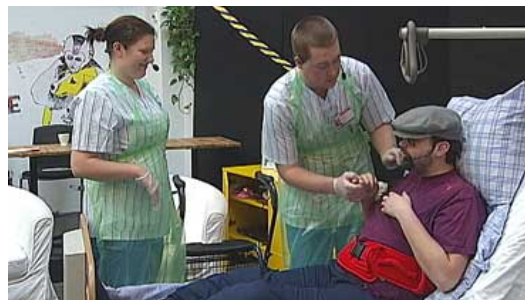
Från Yrkes-SM Karlstad

Efter att ha vunnit regionfinalen i Yrkes-SM i Karlstad i maj blev det i hård konkurrens glädjande en silverplats för två av Alléskolans elever vid omvårdnadsprogrammet.