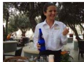
Bilder från Malta där elever från Hotell- och restaurangprogrammet praktiserade i september