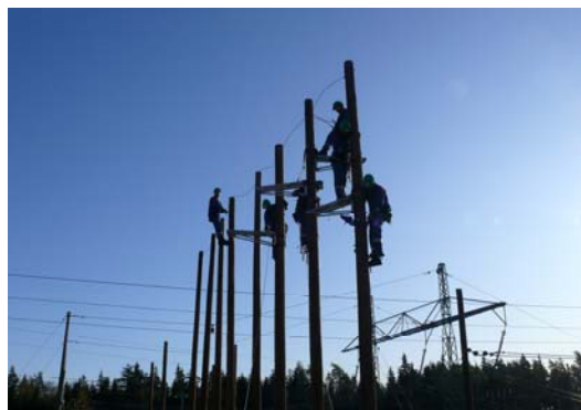
Elever på El-programmet Åsbro Kursgård